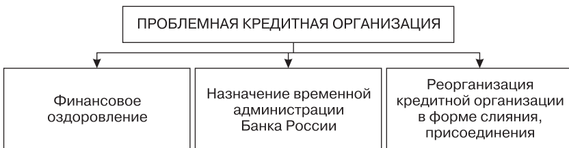
Рис. 5.1. Меры по предупреждению банкротства кредитной организации

Закон о банкротстве кредитных организаций предусматривает меры по предупреждению банкротства кредитных организаций, представленные на рис. 5.1.